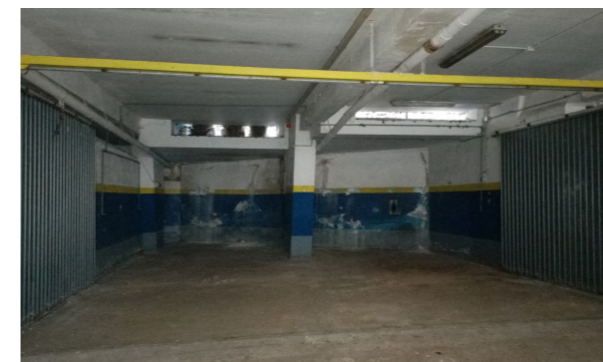
Vista interna autorimessa

L'immobile necessita di interventi di ristrutturazione e adeguamento.