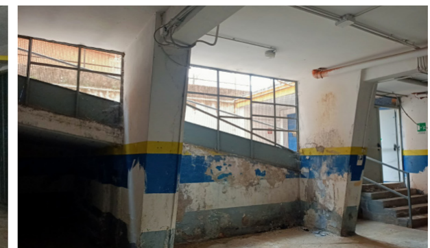
Vista interna autorimessa