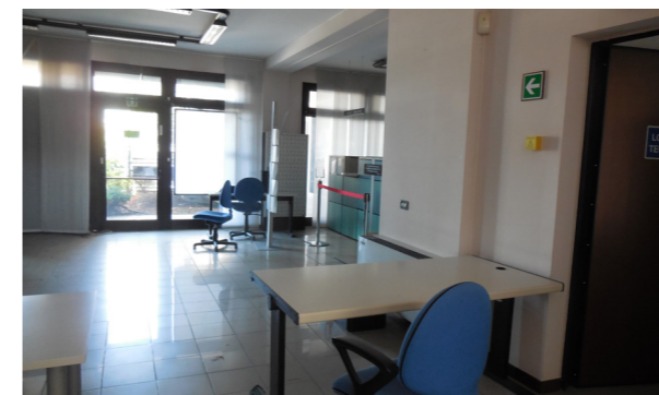
Vista interna unità commerciale/direzionale

Lo stato di manutenzione e conservazione è discreto.