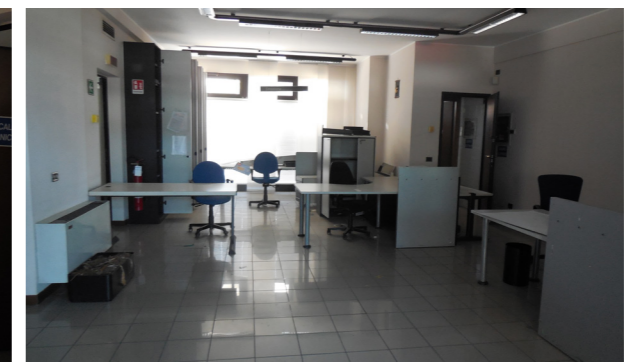
Vista interna unità commerciale/direzionale