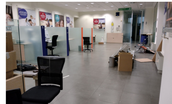
Vista interna unità direzionale

Lo stato di manutenzione e conservazione è buono.