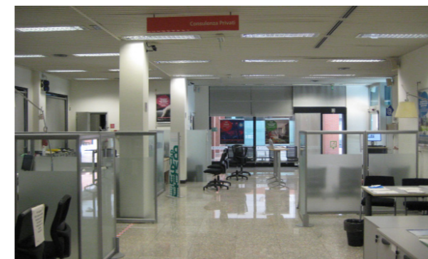
Vista interna unità direzionale

Lo stato di manutenzione e conservazione è buono.