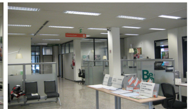
Vista interna unità direzionale