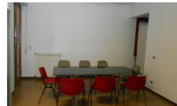
Vista interna unità direzionale

Lo stato di manutenzione e conservazione è discreto.