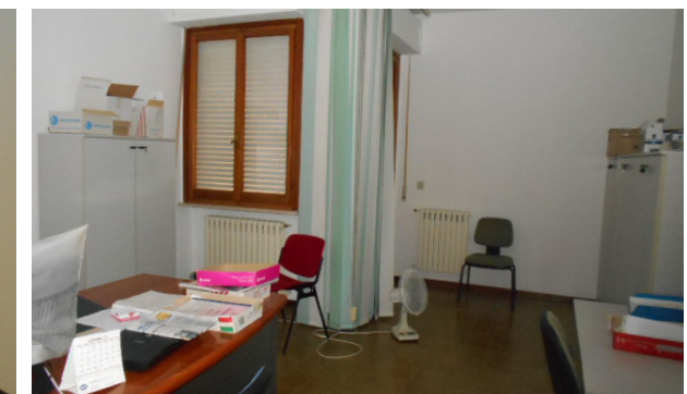
Vista interna unità direzionale