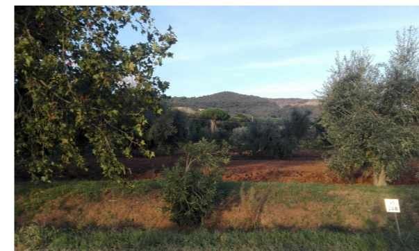
Vista generale dei terreni

La Proprietà si compone di 5 particelle di terreno a destinazione catastale di seminativo, vigneto, seminativo arboreo. Si tratta di una porzione di versante collinare che degrada dolcemente verso la piana, prima di arrivare al mare (a partire dalla quota 135 ml s.l.m. alla quota 74 ml. s.l.m.). Attualmente, i terreni risultano infestati da arbusti tipici della macchia mediterranea.