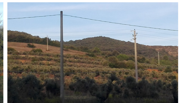
Vista generale dei terreni