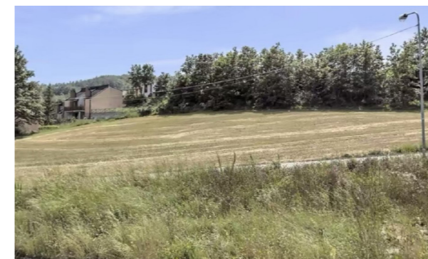
Vista generale terreni

I terreni non sono confinanti tra loro e hanno superfici variabili dai 140 mq ai 3.268 mq, si presentano non coltivati, in buone condizioni e sono caratterizzati da una buona accessibilità.