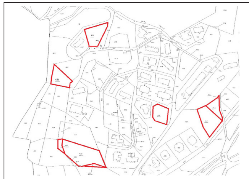
Mappa della distribuzione dei terreni