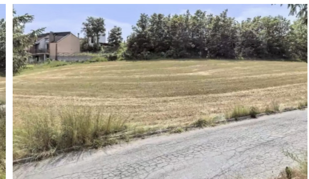
Vista generale terreni