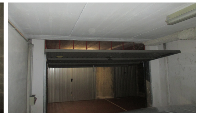
Vista interna box