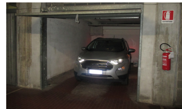
Vista interna box