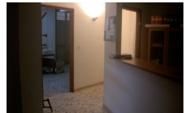
Vista esterna/interna della proprietà