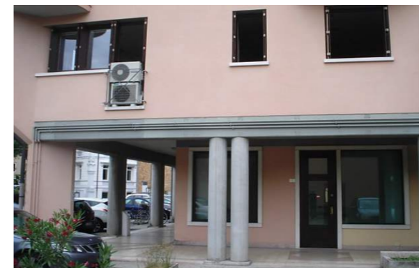
Vista esterna della proprietà