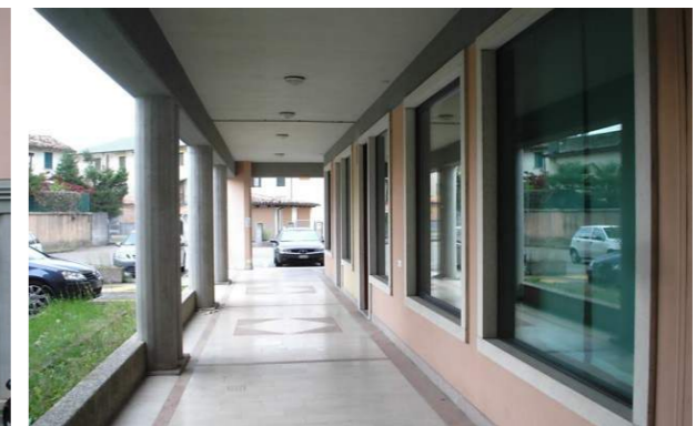
Vista esterna della proprietà