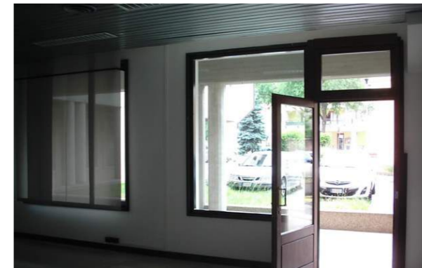
Vista interna della proprietà