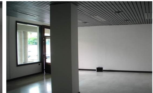
Vista interna della proprietà