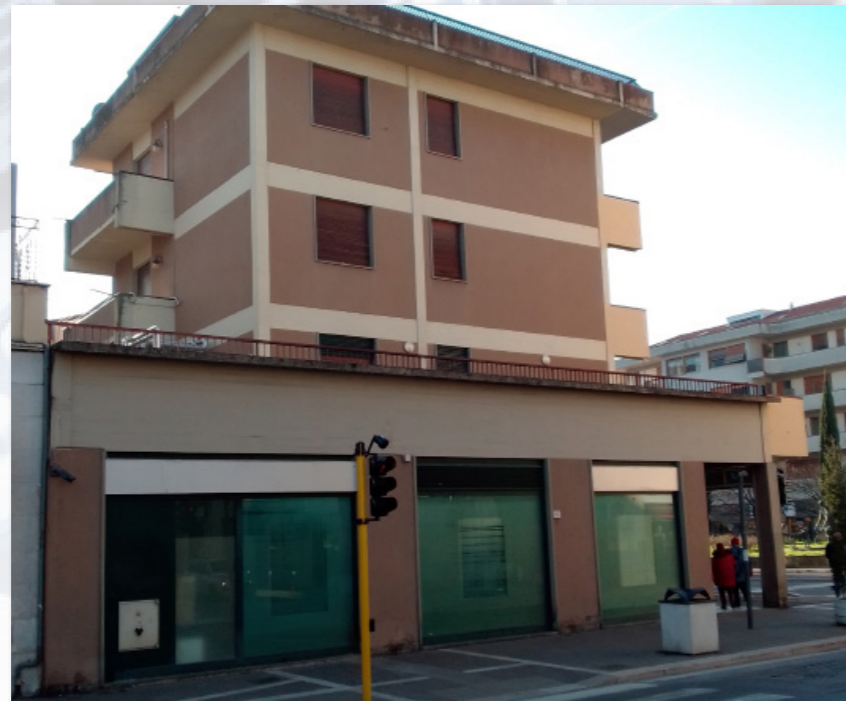
AREZZO (AR) piazza di Saione, 4