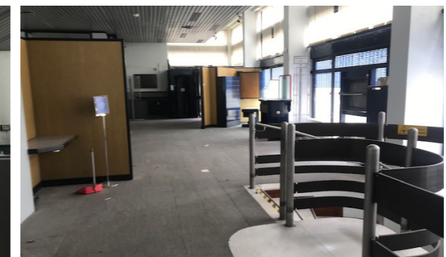
Vista interna unità commerciale