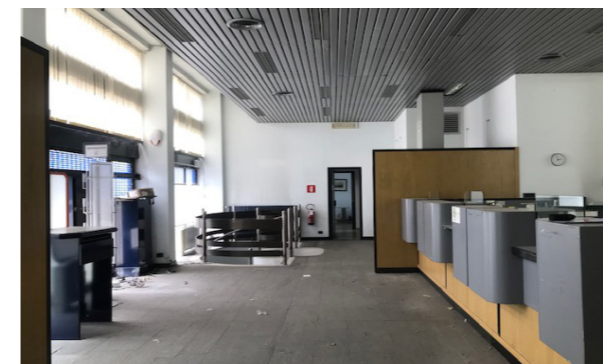
Vista interna unità commerciale