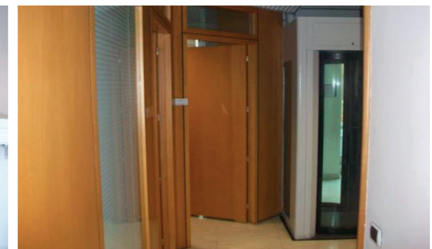
Vista interna unità commerciale