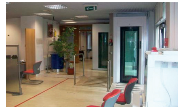
Vista interna unità commerciale

Nel complesso l'unità si presenta in buono stato manutentivo sia interno sia esterno.