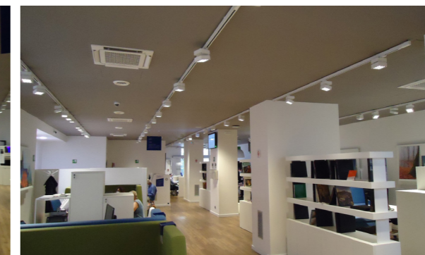
Vista interna unità direzionale/commerciale