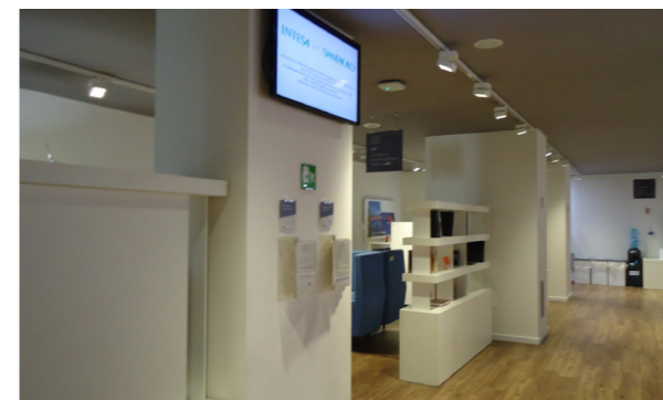
Vista interna unità direzionale/commerciale

Lo stato di manutenzione e conservazione è buono.