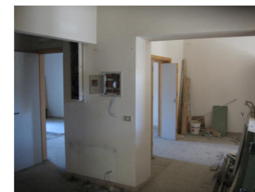
Vista interna della proprietà