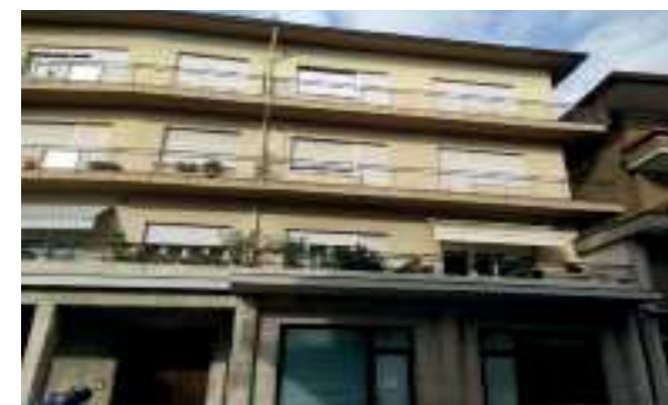
Vista esterna della proprietà