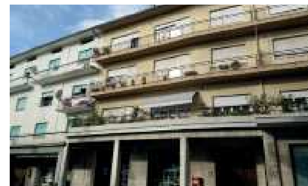
Vista esterna della proprietà

I serramenti esterni al piano terra presentano un'intelaiatura in alluminio anodizzato e pannellature in vetrocamera, mentre ai piani superiori presentano profilature in legno laccato e sono muniti di elementi oscuranti avvolgibili in pvc.