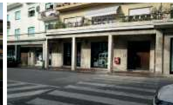
Vista esterna della proprietà