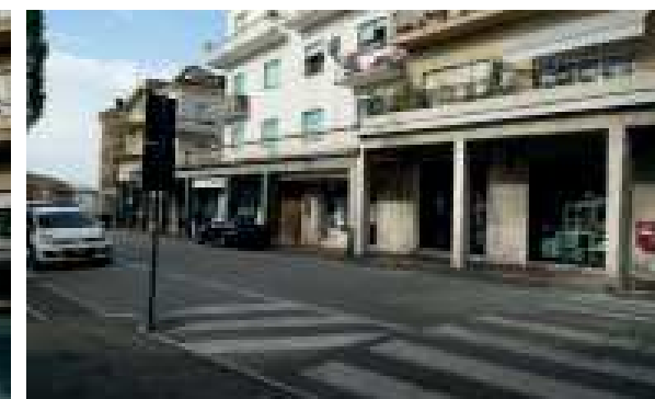
Vista esterna della proprietà