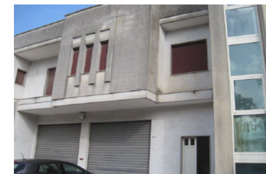
Vista Esterna Fabbricato