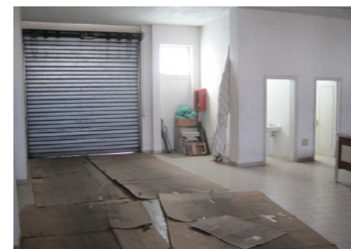
Vista interna box auto