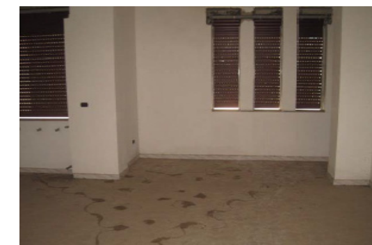
Vista interna ufficio