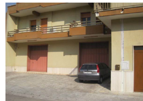
Vista Esterna Fabbricato

I beni in esame sono ubicati all'interno di due fabbricati adiacenti censiti sui mappali 559 e 560. Il fabbricato ricadente sul mappale 559 si sviluppa su due piani fuori terra ed un piano interrato, presenta facciate intonacate e tinteggiate, solaio di copertura piano a terrazza praticabile, parapetti dei balconi in muratura e ringhiera metallica; gli infissi esterni sono in legno e vetro con tapparella in pvc per le unità site al piano primo, mentre in metallo per le unità site al piano terra. Lo stato manutentivo generale risulta essere sufficiente con finiture di qualità economica in linea con i fabbricati limitrofi. Il fabbricato ricadente sul mappale 560 si sviluppa su due piani fuori terra ed un piano interrato, presenta facciate intonacate e tinteggiate di bianco, solaio di copertura piano a terrazza praticabile, parapetti dei balconi in muratura; gli infissi esterni sono in alluminio e vetro con tapparella in pvc per le unità al piano primo mentre in metallo per le unità site al piano terra. Lo stato manutentivo generale risulta essere sufficiente con finiture di qualità economica in linea con i fabbricati limitrofi. Le unità presentano le seguenti finiture interne: pavimenti in ceramica, pareti intonacate e tinteggiate, impianti fuori traccia per i locali accessori mentre sotto traccia per gli uffici e i servizi.