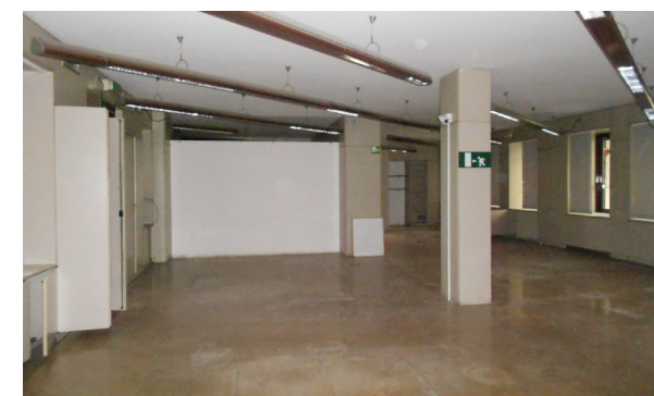
Vista interna unità commerciale

Lo stato di manutenzione e conservazione si può ritenere discreto.