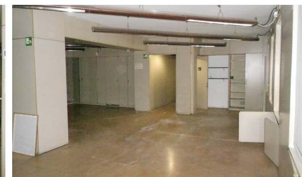
Vista interna unità commerciale