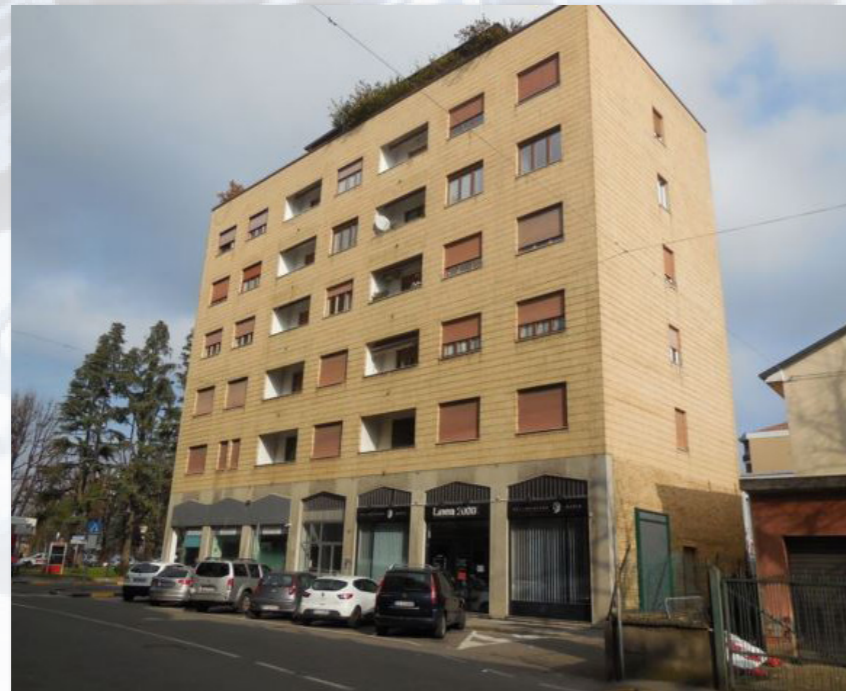
CASSINA DE' PECCHI (MI) via Matteotti, 2/4