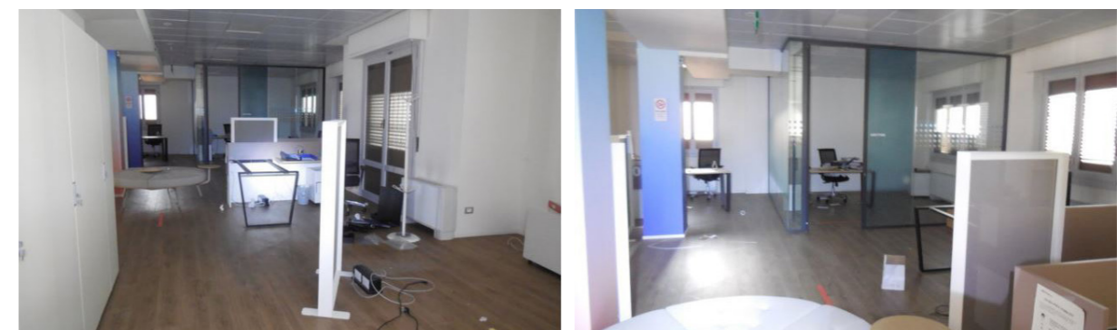
Vista interna unità direzionale

Lo stato di manutenzione e conservazione è buono.