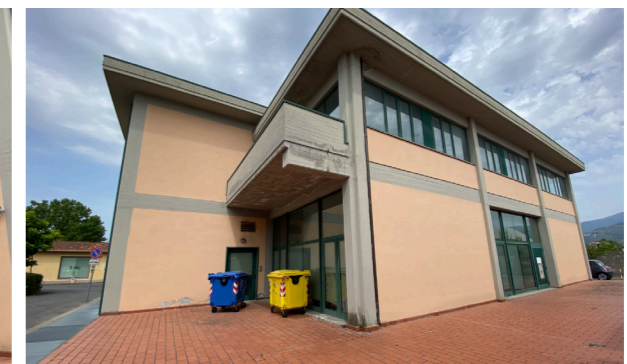
Vista generale esterna, unità commerciale/direzionale