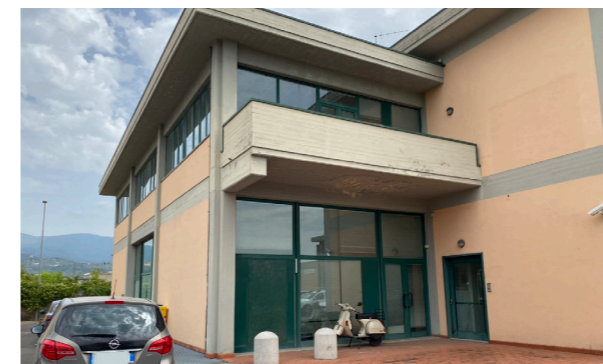
Vista generale esterna, unità commerciale/direzionale

Lo stato di manutenzione e conservazione è discreto.