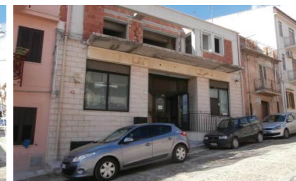
Vista esterna della proprietà