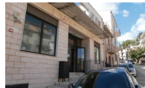
Vista esterna della proprietà

I serramenti interni sono in alluminio e vetro e in tamburato nei bagni. Dal punto di vista impiantistico si segnala la presenza di impianto di riscaldamento e condizionamento; l'acqua calda sanitaria è prodotta da scaldabagni elettrici e sono presenti le usuali dotazioni di impianto elettrico, d'illuminazione ed idrico/sanitario.