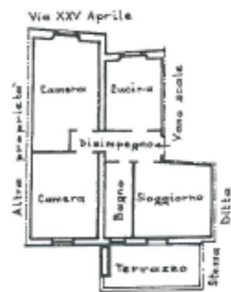
Piano primo - SUB 11