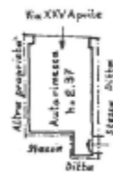
Piano interrato - SUB 14