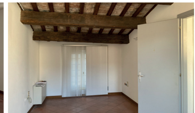
Vista interna unità direzionale