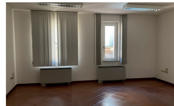
Vista interna unità direzionale

Lo stato di manutenzione e conservazione delle tre unità immobiliari è discreto.