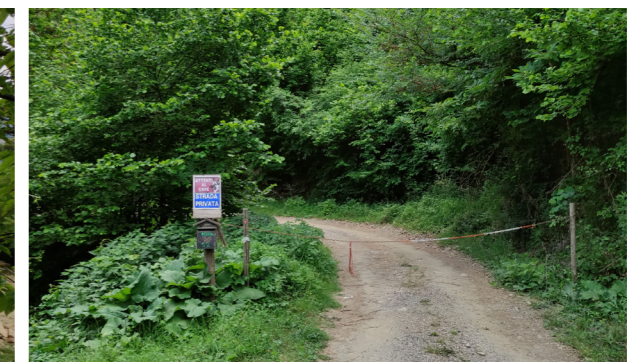
Vista generale dei terreni