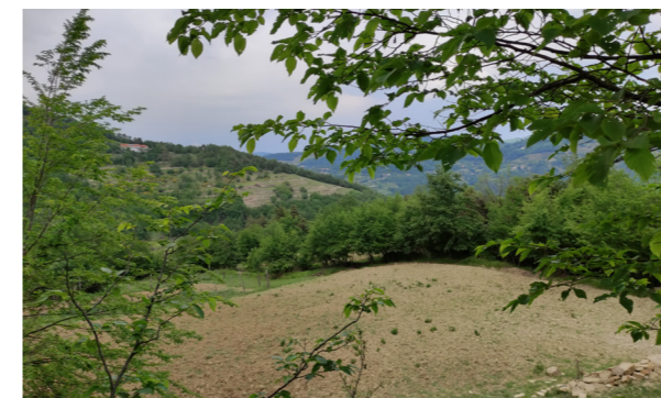
Vista generale dei terreni

La Proprietà è costituita da 9 terreni a destinazione mista bosco e seminativo di superficie complessiva pari a 28.192 mq. I terreni sono confinanti tra loro e hanno superfici variabili da 35 mq a 8.074 mq, si presentano incolti e occupati da vegetazione. Tre di questi terreni in precedenza ospitavano fabbricati diroccati, attualmente però i fabbricati sono stati rimossi/demoliti.