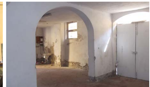
Vista interna della proprietà