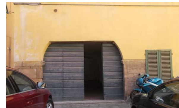
Vista esterna della proprietà

Oggetto della presente analisi valutativa è una porzione immobiliare ubicata al piano terra di un edificio composto da tre piani fuori terra. Tale unità risulta composta da un unico locale, diviso in due parti da un arco, con due accessi (uno da Piazza San Matteo ed uno da Vicolo delle Rocche). L'unità immobiliare è composta da: Piano Terra: locale suddiviso in due parti da un arco, con due accessi. L'unità presenta finiture spartane, in particolare: pavimento in mattonelle, intonacato e tinteggiato, serramenti e portone di accesso in legno. L'appeal dell'immobile è scarso.