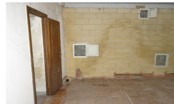
Vista interna unità direzionale

Le finiture interne sono di caratterizzate da: pavimenti ceramica; rivestimenti e pavimenti in ceramica nei servizi; pareti perimetrali intonacate e tinteggiate, ad eccezione delle pareti della ex filiale con conci di tufo a vista; soffitto con volta a botte. L'immobile necessita di un intervento di ristrutturazione.