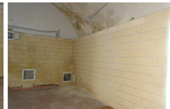
Vista interna unità direzionale