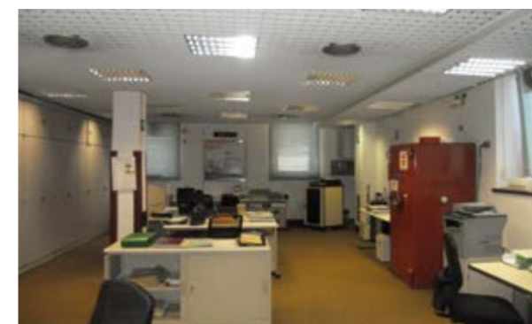
Vista interna della proprietà

Gli impianti elettrici sono in parte a vista (canaline a parete); i serramenti sono lignei (con presenza di alcuni serramenti in alluminio (sostituiti negli ultimi anni); nei servizi igienici è stato posizionato un boiler elettrico per la produzione dell'acqua calda sanitaria.