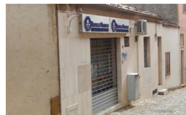
Vista esterna della proprietà

Dal punto di vista impiantistico, sono presenti le usuali dotazioni di impianto elettrico, d'illuminazione ed idrico/sanitario; l'acqua calda sanitaria è prodotta da scaldabagni elettrici.