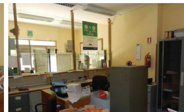
Vista interna della proprietà