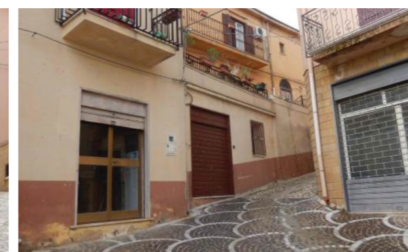
Vista esterna della proprietà