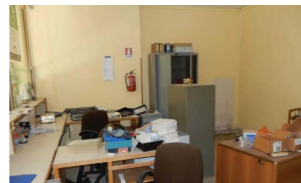
Vista interna della proprietà