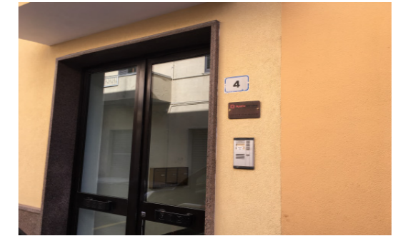
Vista esterna portone di accesso e civico