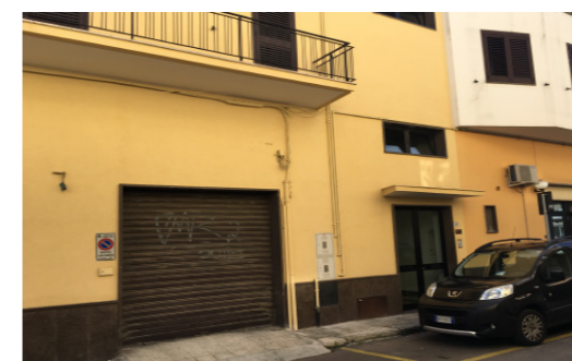
Vista esterna fabbricato