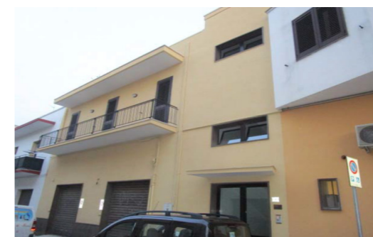
Vista esterna fabbricato

Il fabbricato esternamente si presenta in buone condizioni di manutenzione e finitura il linea con i fabbricati circostanti; presenta struttura portante in c.a. murature esterne in laterizio con facciata di colore uniforme rifinita con intonaco (beige) di tipo Rasato, infissi esterni in alluminio e vetro e copertura piana. L'unità immobiliare in esame risulta planimetricamente composta da soggiorno, studio, disimpegno, w.c., cucina, due camere matrimoniali, ampio terrazzo con lavanderia e balcone. Il grado di manutenzione generale dell'appartamento è da ritenersi sufficiente con finiture di media qualità. Il bene dispone di tutti gli impianti tipici delle residenze (impianto idrico, elettrico, di riscaldamento).