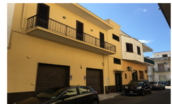
Vista esterna fabbricato