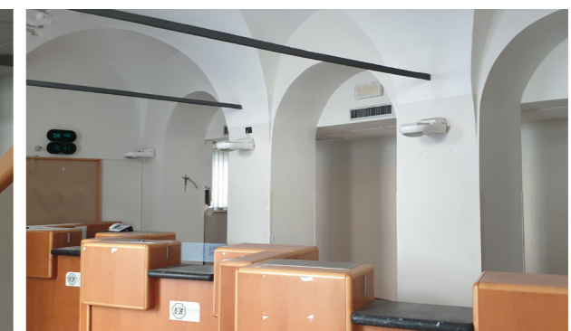
Vista interna unità commerciale/direzionale