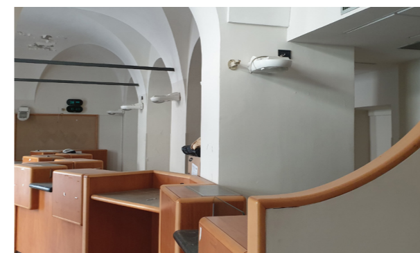
Vista interna unità commerciale/direzionale

Lo stato di manutenzione e conservazione è discreto.