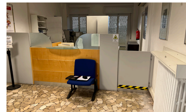
Vista interna unità commerciale/direzionale

Lo stato di manutenzione e conservazione è discreto.