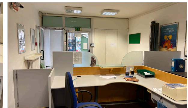
Vista interna unità commerciale/direzionale