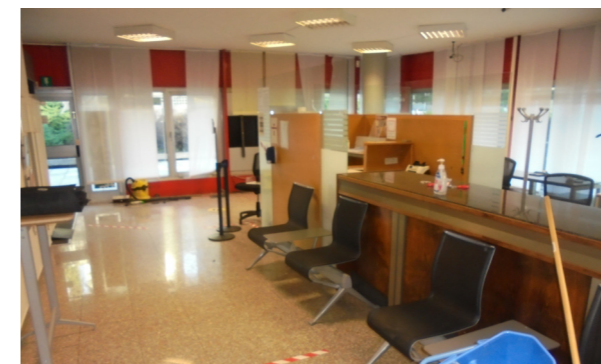
Vista interna unità direzionale/commerciale

Lo stato di manutenzione e conservazione è buono.