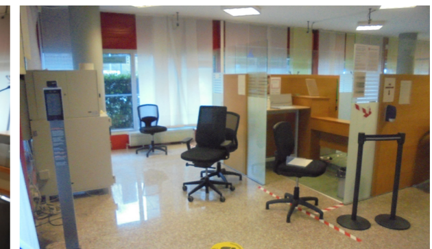
Vista interna unità direzionale/commerciale