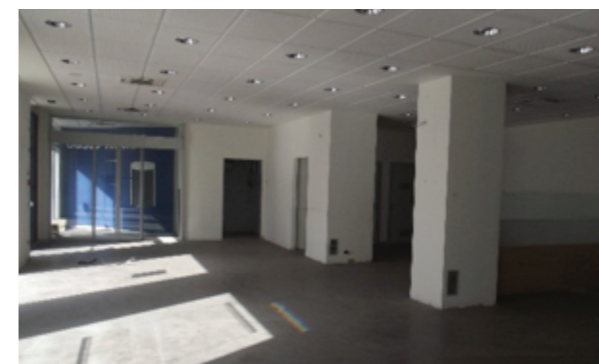
Vista interna della proprietà