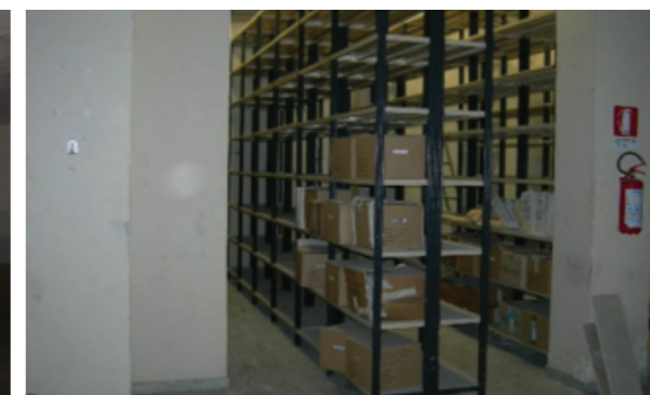
Vista interna della proprietà