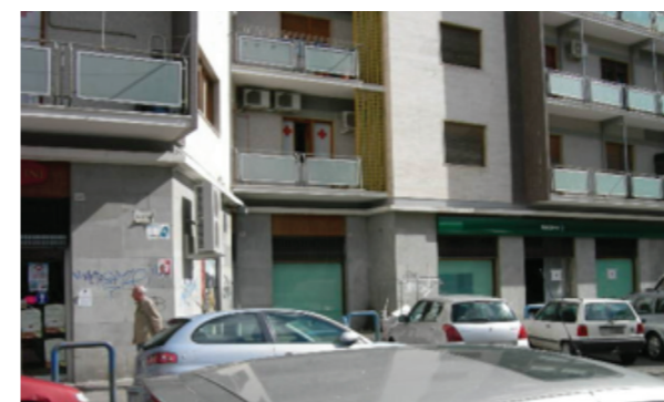
Vista esterna della proprietà

Impiantisticamente i locali dispongono di impianto di condizionamento a tutt'aria con pompa di calore, l'impianto elettrico e d'illuminazione, l'impianto idrico/sanitario, l'impianto d'allarme e quello antincendio.