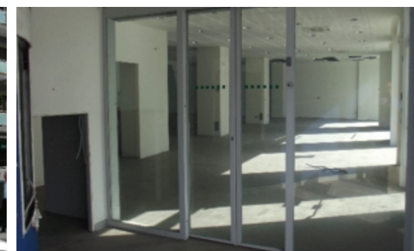
Vista interna della proprietà