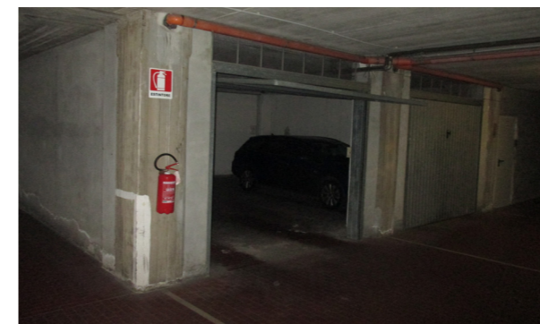
Vista interna box