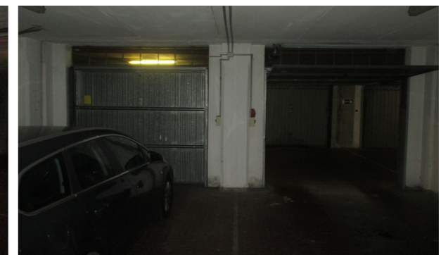
Vista interna box