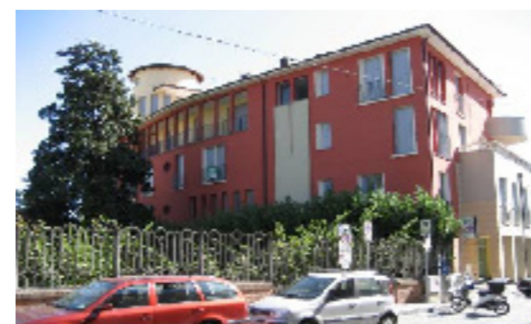
Vista esterna della proprietà

La presente stima ha come oggetto una unità ad uso box (sub.50) inserita in più ampio complesso edilizio, ristrutturato circa cinque anni fa, articolato su quattro piani fuori terra e due interrati e le cui porzioni fuori terra sono destinate a negozi, abitazioni ed uffici. Tale unità, fino a qualche anno fa di pertinenza dell'agenzia bancaria posta a piano terra, è ubicata al piano secondo interrato del complesso. La costruzione evidenzia una struttura portante realizzata in cemento armato ed acciaio, con pilastri e muratura di tamponamento. La copertura è in parte a falde rivestita in tegole di laterizio ed in parte piana terrazzata. L'ingresso principale alle unità si trova su Via Mazzini al n° 32; l'autorimessa si trova all'interno di un più ampio garage, dislocato su due piani entro terra dove sono presenti molte altre autorimesse e posti auto. Il box è raggiungibile attraverso una porta in metallo chiusa a chiave, che dà accesso alla scala che collega con il piano interrato dell'edificio. Il garage è raggiungibile anche mediante l'ascensore adiacente alla scala metallica. Autorimesse al piano 2° interrato. Le pareti interne risultano tinteggiate in colore bianco mentre la pavimentazione è in ceramica in piastrelle monocottura. L'accesso è chiuso da serramento basculante in alluminio. L'unità è dotata di impianto elettrico d'illuminazione ed idrico; oltre all'impianto antincendio. Alla data del sopralluogo, lo stato conservativo e manutentivo risulta più che discreto.