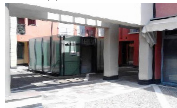
Vista esterna della proprietà