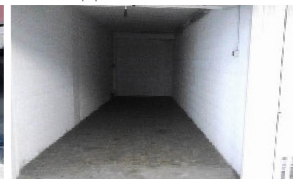
Vista interna della proprietà