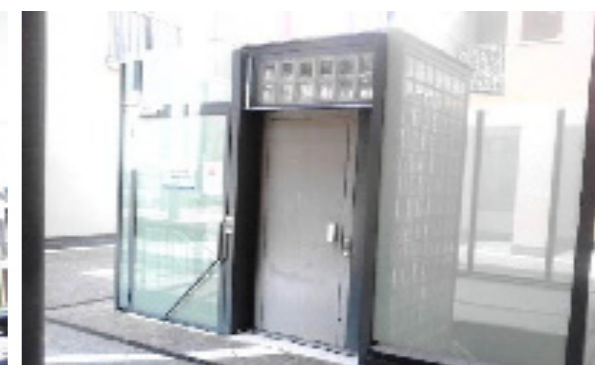
Vista esterna della proprietà