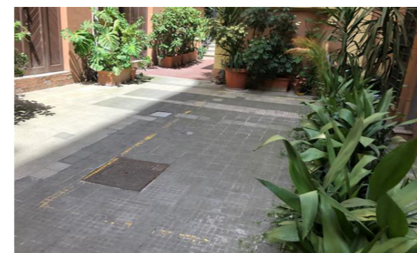
Vista della corte interna e del posto auto

La Proprietà si compone di una unità destinata a posto auto scoperto, ubicato al piano terra di un più ampio complesso immobiliare ad uso misto, risalente ai primi anni del '900, che si sviluppa su cinque piani fuori terra ed un piano interrato. Il posto auto è ubicato nella corte interna dell'edificio, l'accesso alla corte, sia pedonale che carroia, avviene da via Nazionale; la Proprietà e l'intorno sono in buono stato di manutenzione e conservazione.