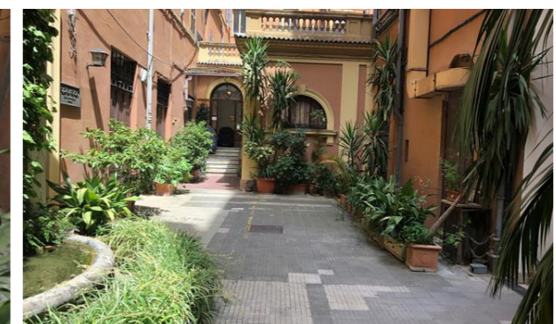
Vista della corte interna e del posto auto