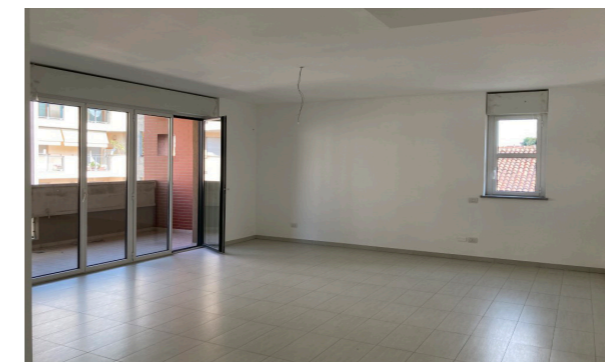
Vista interna unità residenziale

Lo stato di manutenzione e conservazione si può ritenere buono.