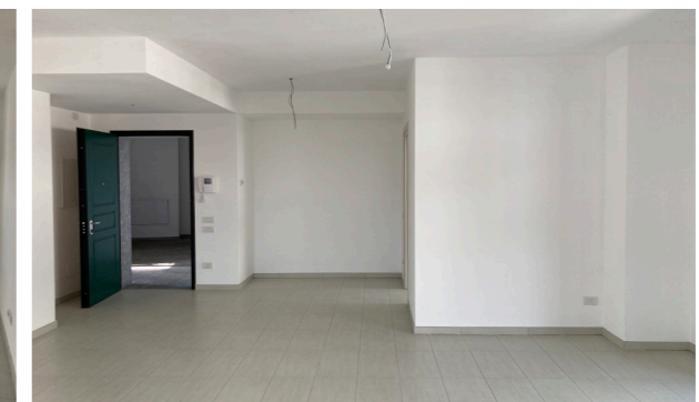
Vista interna unità residenziale