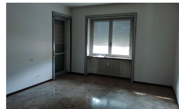
Vista interna unità residenziale

Il compendio immobiliare si compone di n.11 unità immobiliari aventi prevalente destinazione d'uso residenziale, oltre superfici destinate ad autorimessa e cantine, facenti parte di un fabbricato ad uso misto, risalente ai primi anni del '900, che si sviluppa su 5 piani fuori terra e 1 piano interrato. In particolare sono presenti: 3 box auto al piano interrato, 2 posti auto al piano terra e 6 appartamenti, di cui 3 al piano primo, 1 al secondo e 2 al terzo, oltre a 6 cantine al piano interrato e 4 al piano quarto abbinata alle unità. Il fabbricato presenta struttura portante di tipo tradizionale in cemento armato, con copertura a doppia falda e tamponamenti esterni in muratura intonacata e tinteggiata, nonché serramenti in legno e vetrocamera. Le unità residenziali sono composte da ingresso, soggiorno, cucina, due o quattro camere, uno o due bagni, ripostiglio, alcune sono dotate di balcone o terrazzo. Il collegamento verticale è garantito da un corpo scala ad uso condominiale realizzato in muratura. Le finiture interne sono di discreto livello, caratterizzate da: pavimenti in marmo, rivestimenti in ceramica nei servizi, pareti perimetrali e soffitti intonacati e tinteggiati, tramezzi realizzati in laterizio intonacato e tinteggiato. Lo stato di manutenzione e conservazione è discreto.