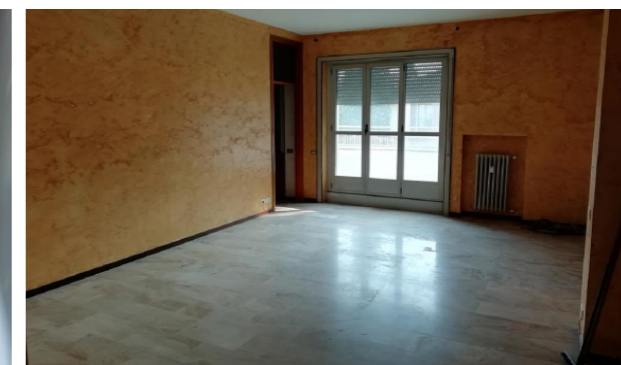
Vista interna unità residenziale