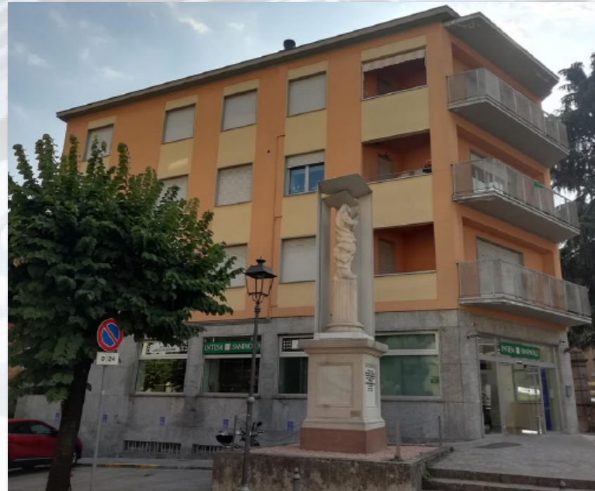
ALZANO LOMBARDO (BG) Piazza Garibaldi, 3