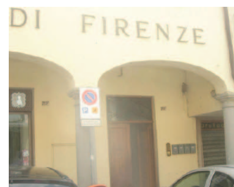
Vista esterna della proprietà

L'appartamento ha finiture di tipo civile datate, costituite da pavimento in marmette di graniglia ed impianto di riscaldamento a termosifoni collegato alla centrale termica della Banca.