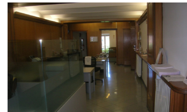
Vista interna unità commerciale

Lo stato di manutenzione e conservazione si può ritenere discreto.