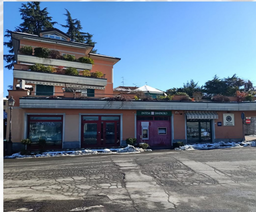
STAZZANO (AL) via Fossati, 2-A