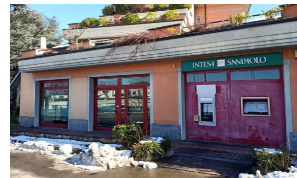
Vista esterna unità direzionale

Lo stato di manutenzione e conservazione è discreto.