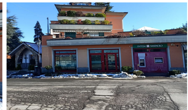
Vista esterna unità direzionale