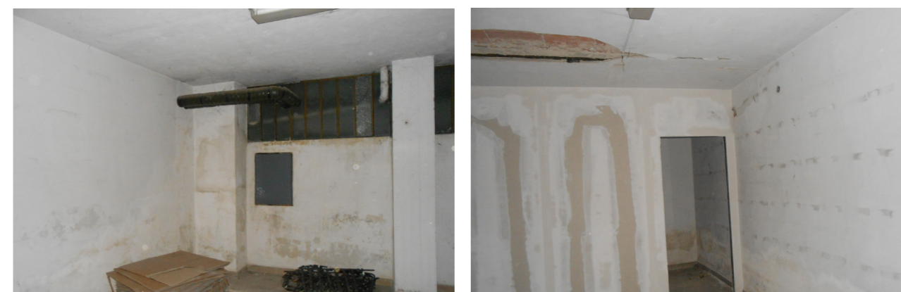
Viste interne dell'unità immobiliare

Il locale è costituito da un unico vano rettangolare, raggiungibile dallo stretto corridoio delle cantine, provvisto di finestratura alta a nastro sullo scannafosso. Sul lato destro, una parte in cartongesso dal montaggio non terminato separa un piccolo locale all'interno del quale è collocata una fossa biologica di recente realizzazione. Le pareti sono intonacate e presentano, nella parte bassa, l'affiorare di umidità di risalita. La porta di accesso è in legno tamburato mentre le finestre presentano un telaio in ferro. Il pavimento è in battuto di cemento. L'unità è sprovvista di allacciamento alle utenze e di impianti. Stato di manutenzione sufficiente per l'attuale destinazione.