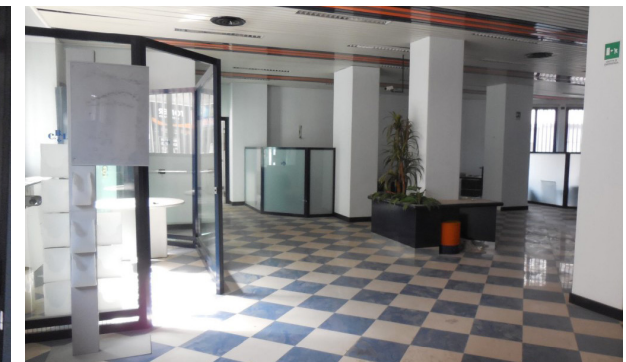
Vista interna unità commerciale/direzionale