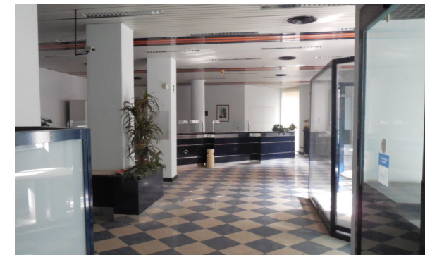
Vista interna unità commerciale/direzionale

Lo stato di manutenzione e conservazione è discreto.