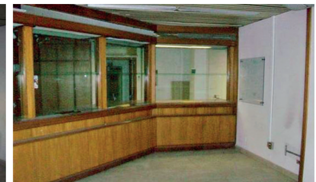
Vista interna unità commerciale