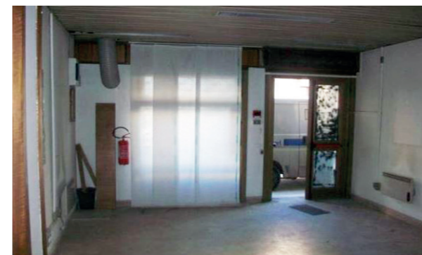
Vista interna unità commerciale

Nel complesso il locale commerciale al piano terra si presenta in sufficiente stato manutentivo interno mentre l'esterno si presenta in discrete condizioni.