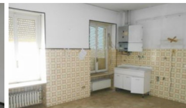
Vista interna unità residenziale