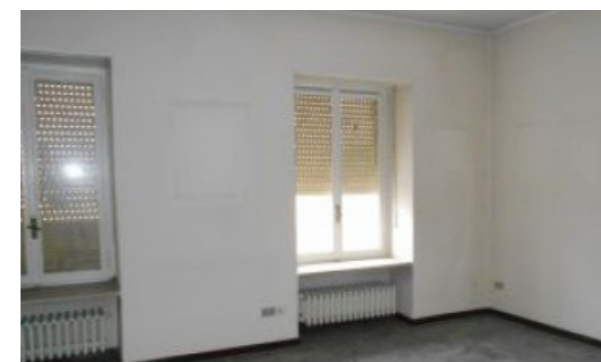
Vista interna unità residenziale

Lo stato di manutenzione e conservazione è discreto.