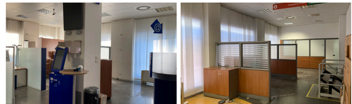
Vista interna unità direzionale

Lo stato di manutenzione e conservazione è buono per quanto riguarda l'ex filiale bancaria, discreto per i box.