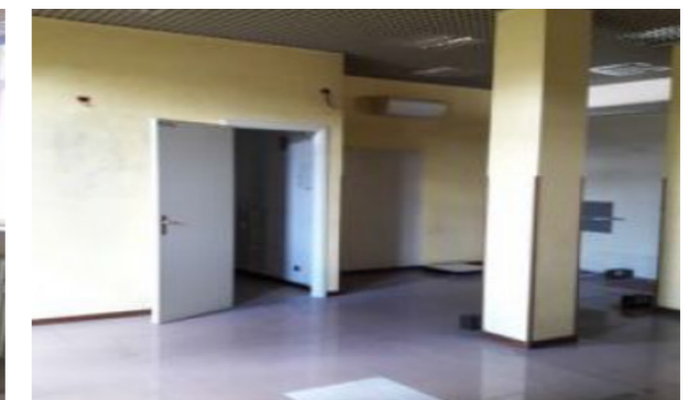
Vista interna unità commerciale