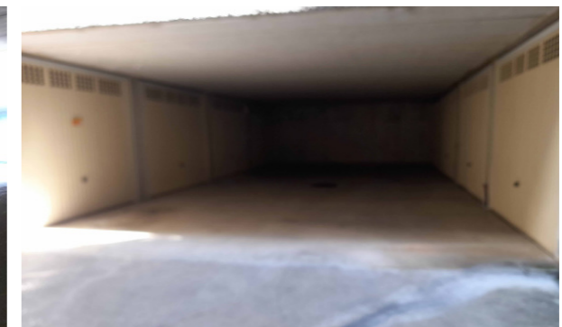
Vista interna unità