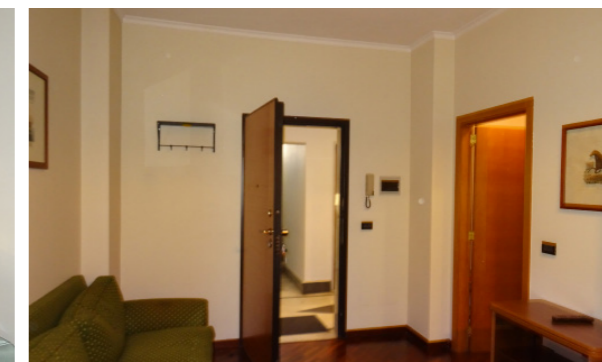
Vista interna unità residenziale