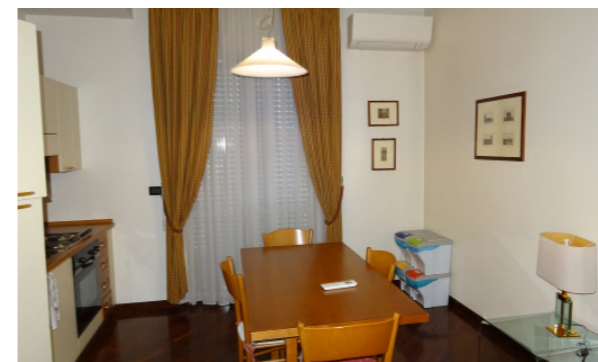
Vista interna unità residenziale

Il garage è disposto su un livello, al piano terra, suddiviso in un unico ambiente stretto e lungo, con area di pertinenza retrostante. Le finiture interne sono caratterizzate da: pavimenti in ceramica; pareti interne intonacate e tinteggiate, illuminazione con lampade a neon sul soffitto. Il lastrico solare/terrazzo occupa l'intero piano settimo, in questa zona oltre al torriano scala del palazzo, sono presenti anche due locali tecnici (locale ascensore e un deposito). Il terrazzo presenta pavimentazione con guaina bituminosa. Lo stato di manutenzione e conservazione generale è discreto.