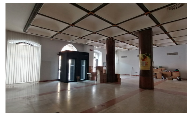
Vista interna unità commerciale

Lo stato di manutenzione e conservazione si può ritenere discreto.