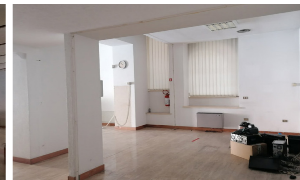
Vista interna unità commerciale